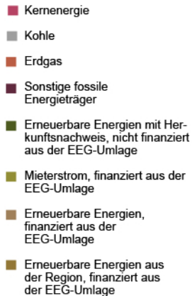
Gesamtenergieträgermix des Unternehmens

Angaben auf der Basis vorläufiger Daten für das Jahr 2020